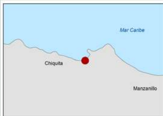
Diagrama de Ubicación Local